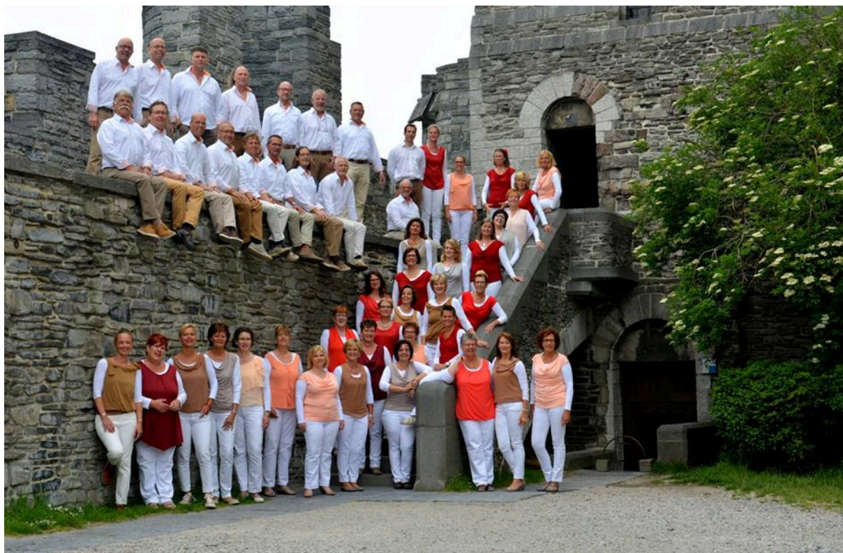
Tijdens de koorreis naar Gent, 2015